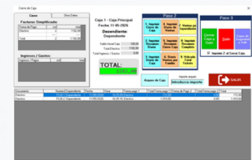
Cierre de caja e informes