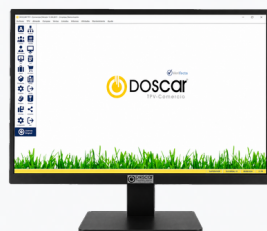
Gestión de ventas